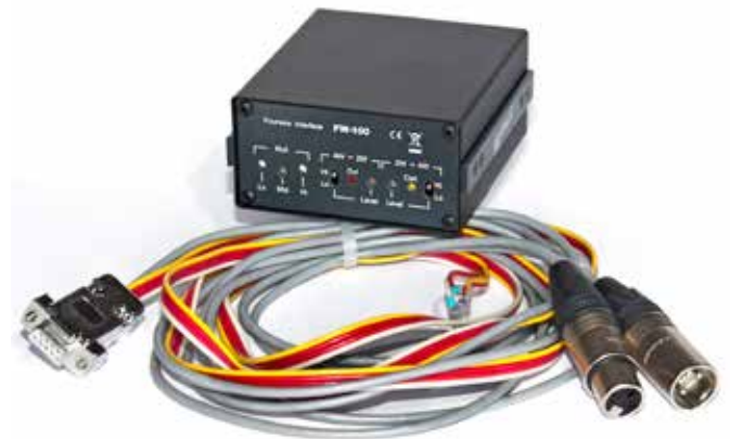
Optionales DB9-Kabel wird ohne XLR-Stecker geliefert.

lebigen Betrieb untergebracht. Die notwendige Spannungsversorgung für die Adapterelektronik erfolgt über das Partyline-Intercomkabel.